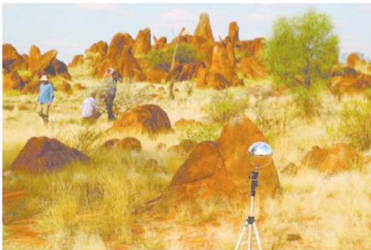
Prototypes pour l'exposition « Otto », 2018.